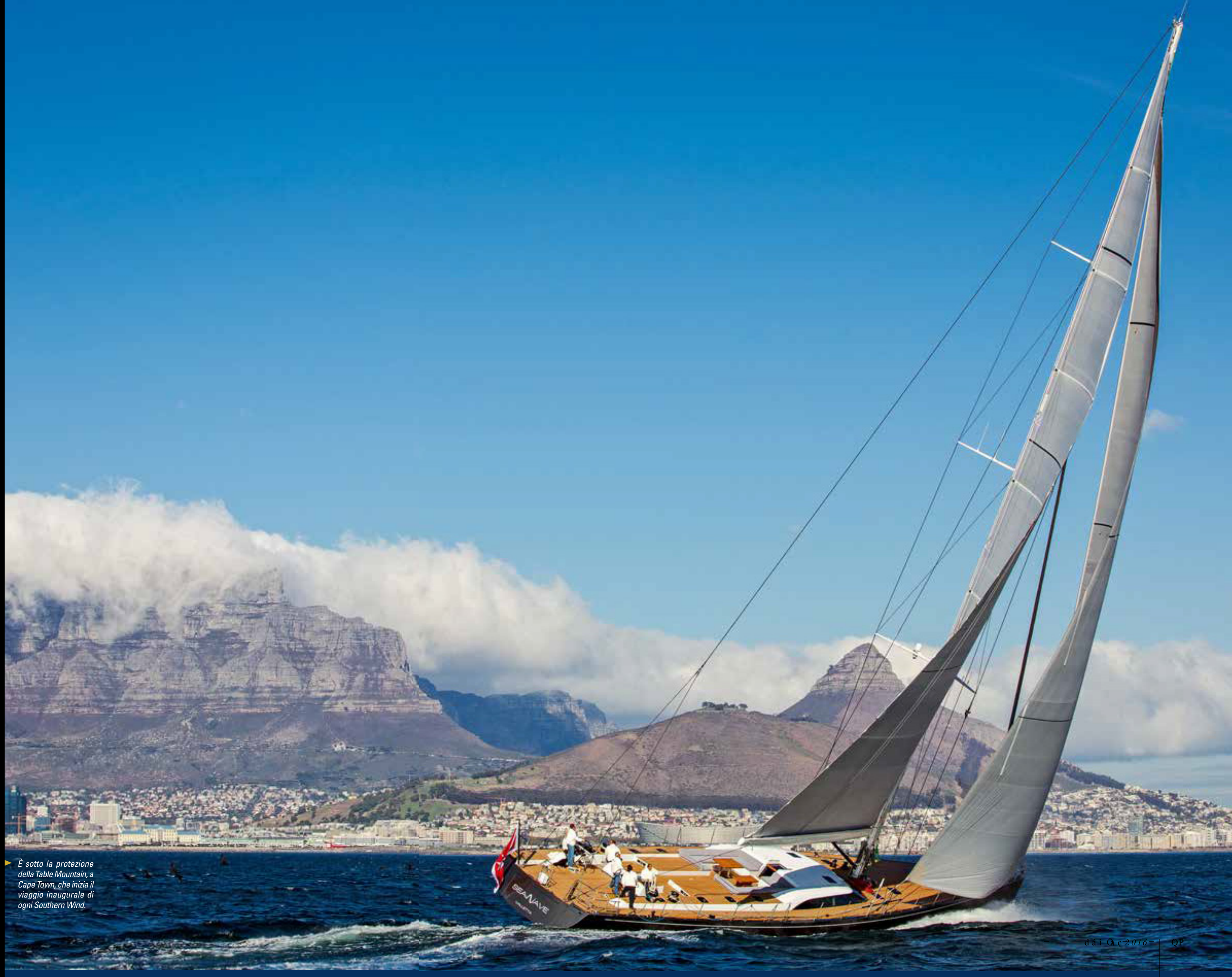
È sotto la protezione della Table Mountain, a Cape Town, che inizia il viaggio inaugurale di ogni Southern Wind.

Una gamma, quella prodotta dal 1991 a oggi, che nel tempo è stata sviluppata con 47 imbarcazioni semi-custom prodotte dai 72 ai 110 piedi di lunghezza, con modelli Raised Saloon, Deck Saloon e Flush Deck, che portano firme di primaria importanza nella progettazione di scafi a vela e dello yacht design: Farr, Reichel Pugh, ma soprattutto quella di Mario Pedol e del suo studio milanese Nauta Design.